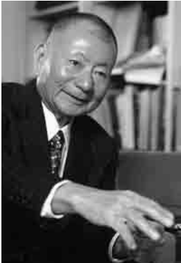
宮脇 昭 (みやわき あきら)