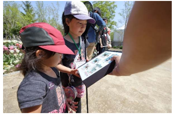
トランキキットによる説明