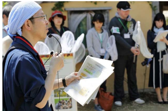
セイヨウについて(道庁)