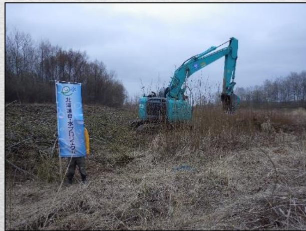
ヤナギ覆土状況(4月20日)