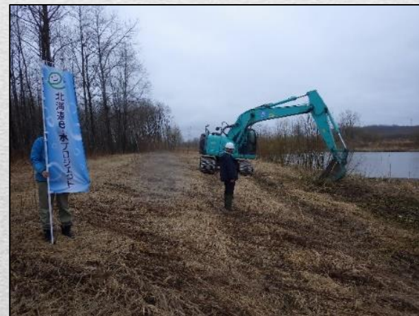
ヤナギ踏圧状況(4月20日)