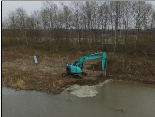
掘削状況(ドローン撮影:4月22日)