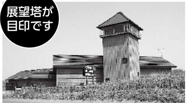
石狩浜海水浴場植物保護センター